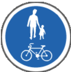
Gang- og hjólreiðastígur.

Merki þetta má nota við stíga sem gangandi vegfarendur og hjólreiðamenn skulu nota en ekki aðrir.